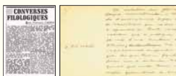
Mostra de textos compilats per al projecte «Obres completes de Pompeu Fabra».