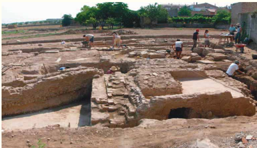
Treballs al jaciment arqueològic de l'antiga ciutat de Iesso corresponents al programa «Recerca arqueològica a Guissona».

Les seccions de l'Institut fan recerca i programen activitats en les disciplines pròpies conjuntament amb les societats filials. A més a més, la Secretaria Científica executa les propostes de la Comissió d'Investigació aprovades pel Consell Permanent i impulsa el funcionament dels programes de recerca de seccions, societats filials, centres, laboratoris i oficines.