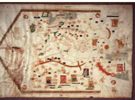
Carta portolana de Gabriel Vallseca (any 1439), que es conserva a les Drassanes de Barcelona i pertany a l'Institut d'Estudis Catalans. Correspon al programa de recerca «La representació de l'espai a les cartes portolanes itàliques i catalanes».