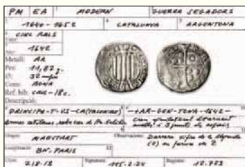
Model de fitxa utilitzat al programa «Banc de dades de monedes catalanes», que pretén informatitzar totes les dades disponibles sobre monedes i medalles, especialment de l'àmbit català.